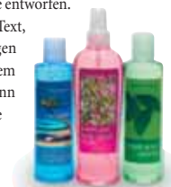
Etiketten für Kosmetikprodukte!

Sie können jede Kombination von Text, Grafiken, Fotos und Abbildungen miteinander verbinden. Jede auf Ihrem Computer installierte Schriftart kann gedruckt werden, was Ihnen maximale Flexibilität und Kreativität bei Ihren Etikettendesigns ermöglicht.