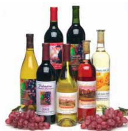
Etiketten für Weinflaschen!

Mit dem LX810 produzieren Sie qualitativ hochwertige, professionelle Etiketten für alle Produkte, die spezielle Kleinauflagen erfordern. Der LX810 ist außerdem hervorragend für den Einsatz als Proof-Drucker für spätere Großauflagen geeignet, nicht zu vergessen Verpackungsetiketten mit Bar-Codes, private Etiketten und den Einsatz bei Werbekampagnen.