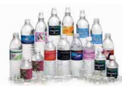
Etiketten für Wasserflaschen!

Der LX810 druckt auf viele verschiedene Materialien einschließlich hochglänzende, matte und seidenmatte Etiketten. Sie können auch Aufkleber, Kunststoffe, Endlospapier, transparentes Polyester und leicht klebbares Material bedrucken. Es gibt sogar Hochglanzetiketten, die hochgradig wasserresistent sind. Sie sind perfekt für Etiketten auf Kisten/Kartons, die Wasser, Regen oder Schnee ausgesetzt werden.